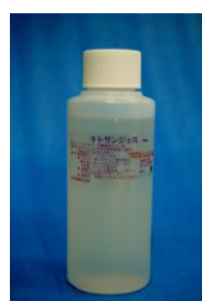
100ml ¥1,000 円税抜