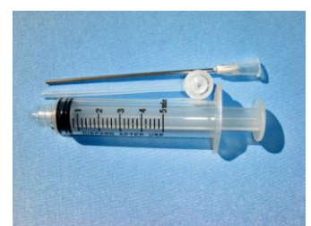
小分け注射器 1~5ml 300 円税抜